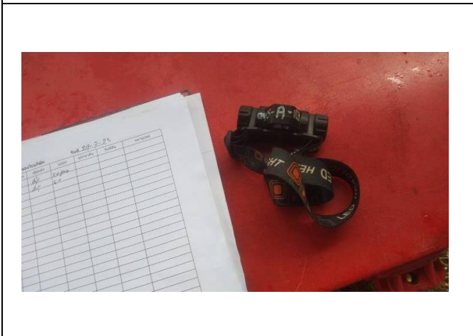
รายการเบิกของแฉก IN SU