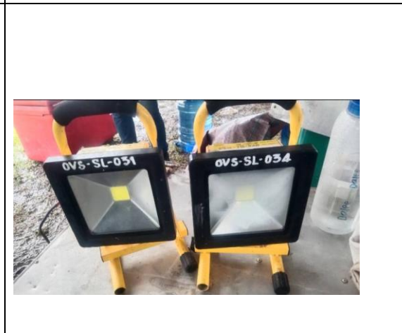
รายการเบิกของแฉก Ex Jion