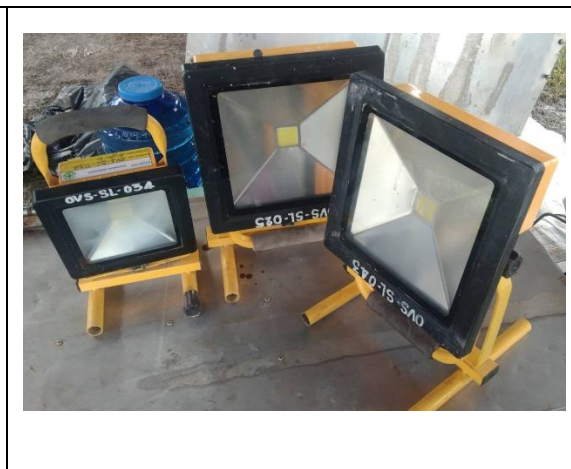
รายการเบิกของแฉก IN SU